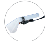
Bocchetta optional per poltrone e divani Optional tool for armchairs and sofas