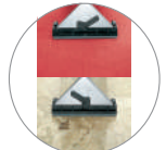
Bocchetta moquette e pavimenti duri di serie Carpet/Hard floors