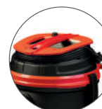
Pratico avvolgicavo Cord reel