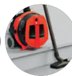
Parcheggio su scala Stairs parking