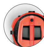
Sporgenze paracolpi Plastic bumper